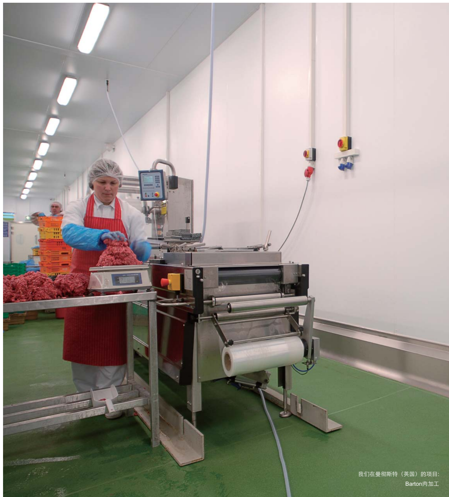
我们在曼彻斯特（英国）的项目： Barton肉加工