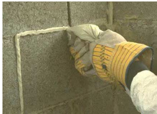
Obr. 2: Aplikácia pomocou plastového vrečka

Aby sa dosiahla dobrá prídržnosť, je potrebné aplikovať materiál na vopred navlhčený podklad, pred aplikáciou je ale nutné odstrániť kaluže.