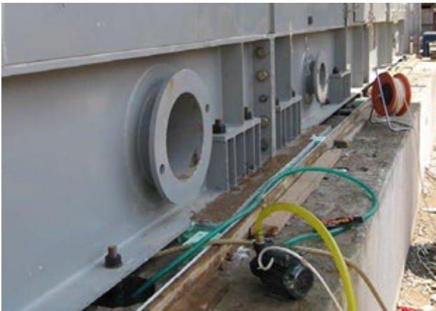
Obr. 1. Saturácia a odstránenie prebytočnej vody z kotviacich otvorov základov turbíny pred zalievaním.

Úložné dosky, skrutky, atď musia byť čisté, bez oleja, mastnoty, náterov atď. Umiestniť a vyrovnať zariadenie. Ak je po vytvrdnutí zálievky potrebné odstrániť klíny, je dobré ich kvôli ľahšiemu odstráneniu vopred mierne namastiť.