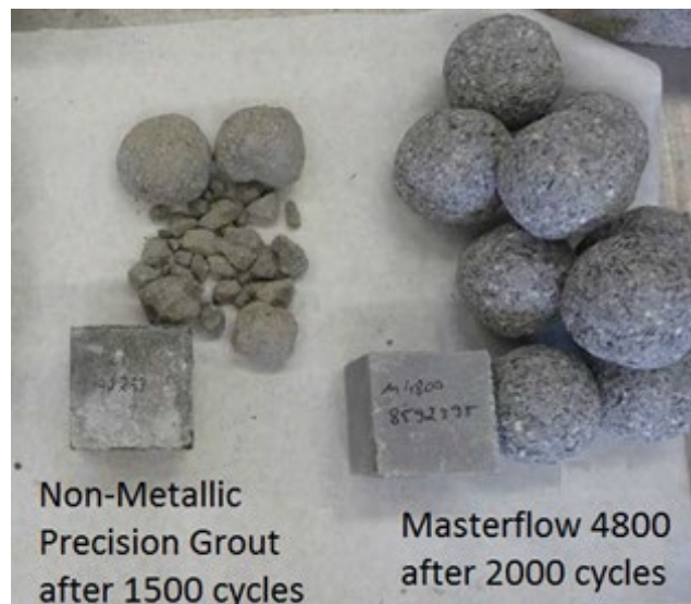
Obr. 3. Vzorky zálievkových hmôt po 1500 a 2000 cykloch.