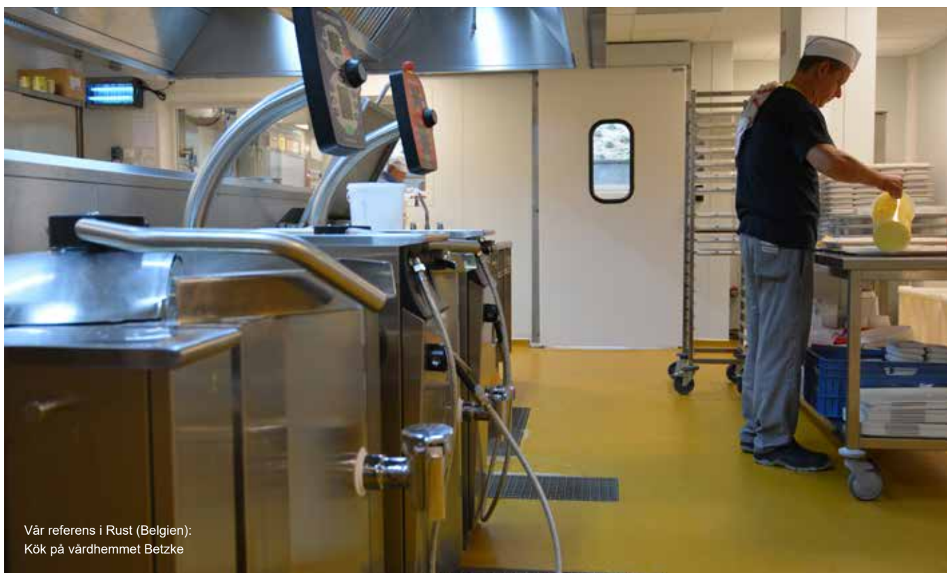
Vår referens i Rust (Belgien): Kök på vårdhemmet Betzke

Ucretegolv utvecklades ursprungligen för att möta kraven inom industrin. De är därför extra slitstarka och stöttåliga, vilket gör att de till exempel inte tar skada av tappade grytor. Samtidigt har Ucretegolv god kemisk resistens och tål citronsyra, ättika, socker och liknande. Golven kan också användas i kyl- och frysrum då de klarar temperaturer ned till -40 °C.