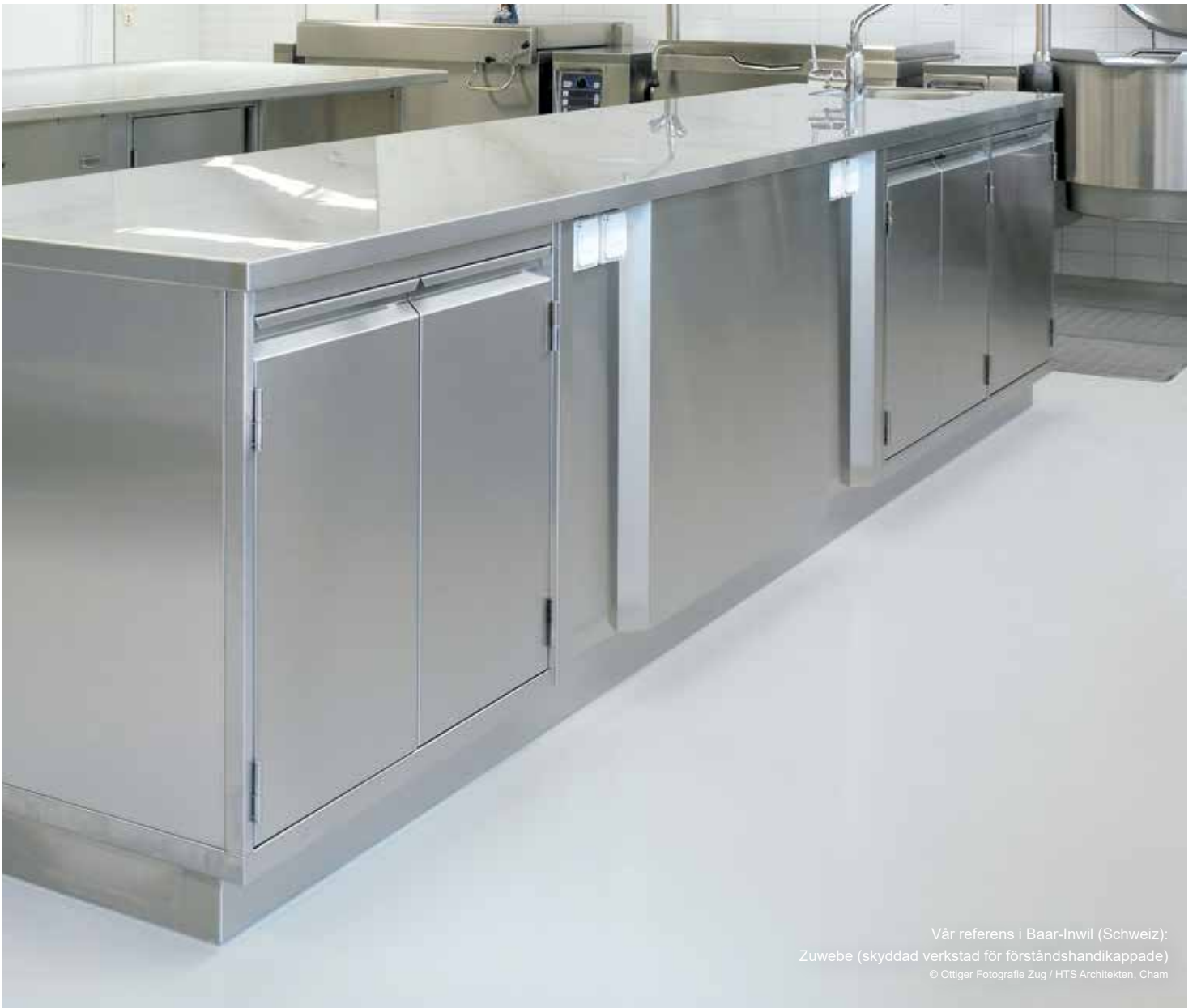
Vår referens i Baar-Inwil (Schweiz): Zuwebe (skyddad verkstad för förståndshandikappade) HTS Architekten, Cham