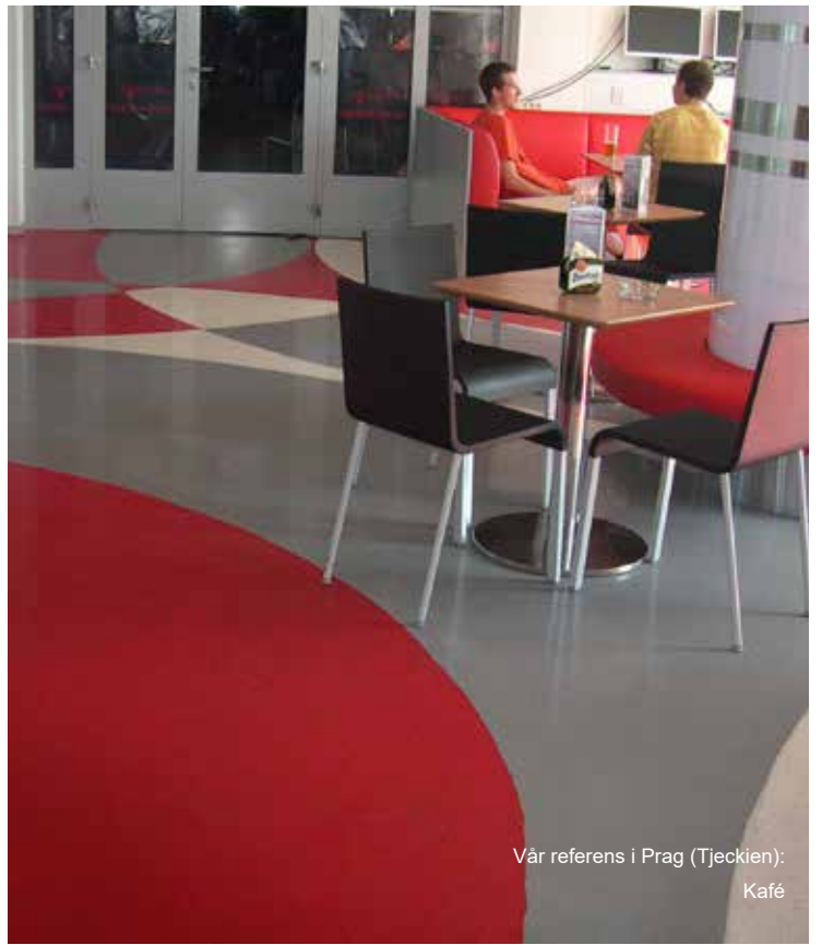
Vår referens i Prag (Tjeckien): Kafé