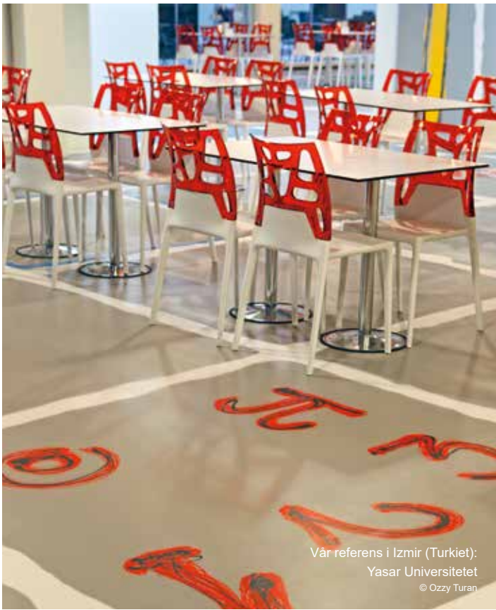
Vår referens i Izmir (Turkiet): Yasar Universitetet © Ozzy Turan