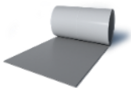
SikaProof®-934 (MasterSeal® 934) Односторонняя гидроизоляционная клейкая лента, FPO — бутилкаучук