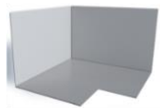
SikaProof®-754 IC (MasterSeal® 754 IC) Самоклеющийся гидроизоляционный внутренний угловой элемент, FPO — бутилкаучук