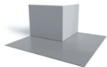
SikaProof®-754 OC (MasterSeal® 754 OC) Самоклеющийся гидроизоляционный внешний угловой элемент, FPO — бутилкаучук