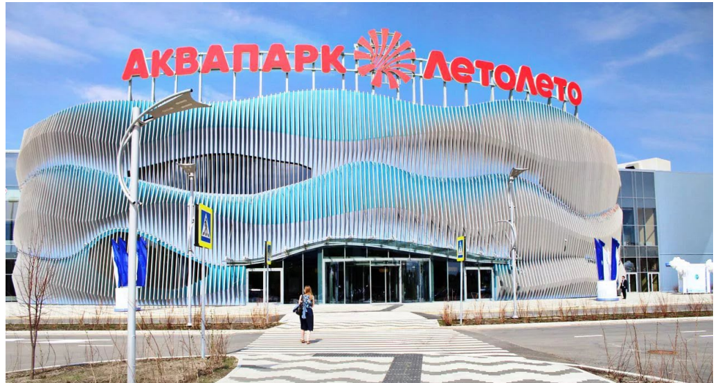
Объект Аквапарк «ЛетоЛето», г. Тюмень (Россия)

PCI Latex, PCI Seccoral, PCI Nanolight, PCI Pectape, PCI Durapox, PCI Silcofug, MasterFlow, MasterSeal, MasterEmaco, MasterGlenium, MasterPolyheed