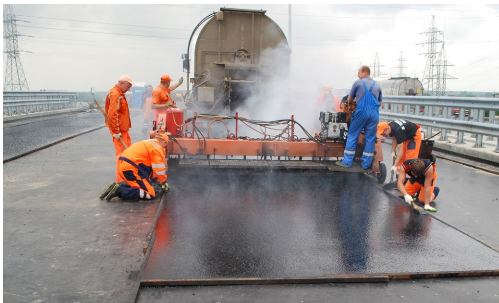
Объект мост-эстакада через реку Чаченку