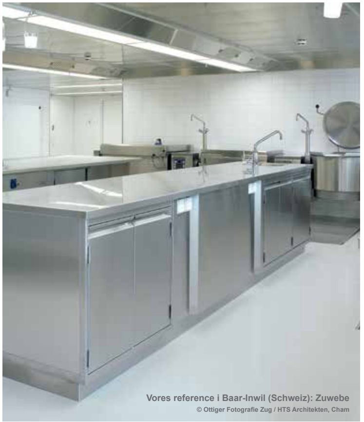
Vores reference i Baar-Inwil (Schweiz): Zuwebe HTS Architekten, Cham