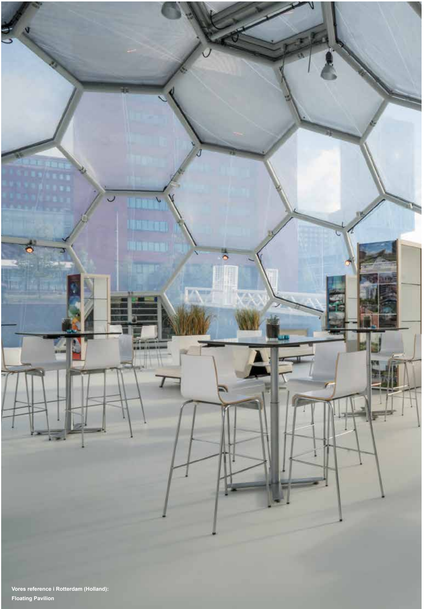
Vores reference i Rotterdam (Holland): Floating Pavilion