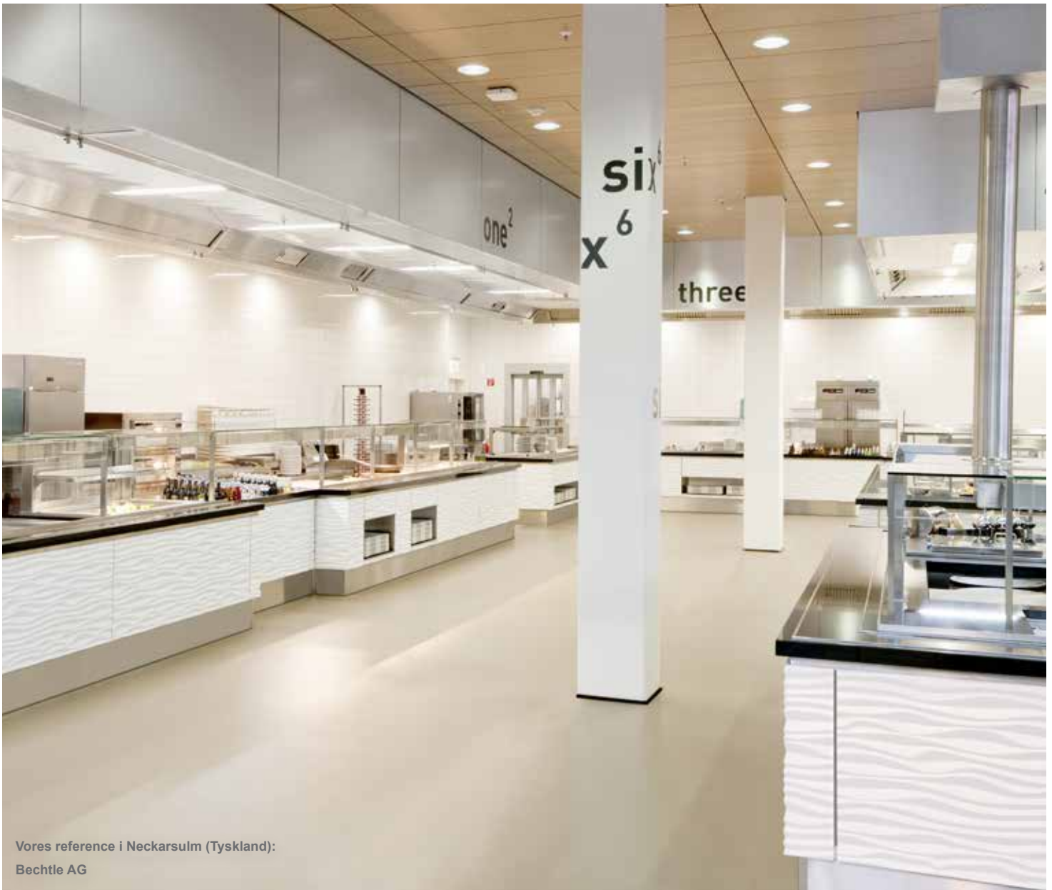
Vores reference i Neckarsulm (Tyskland): Bechtle AG