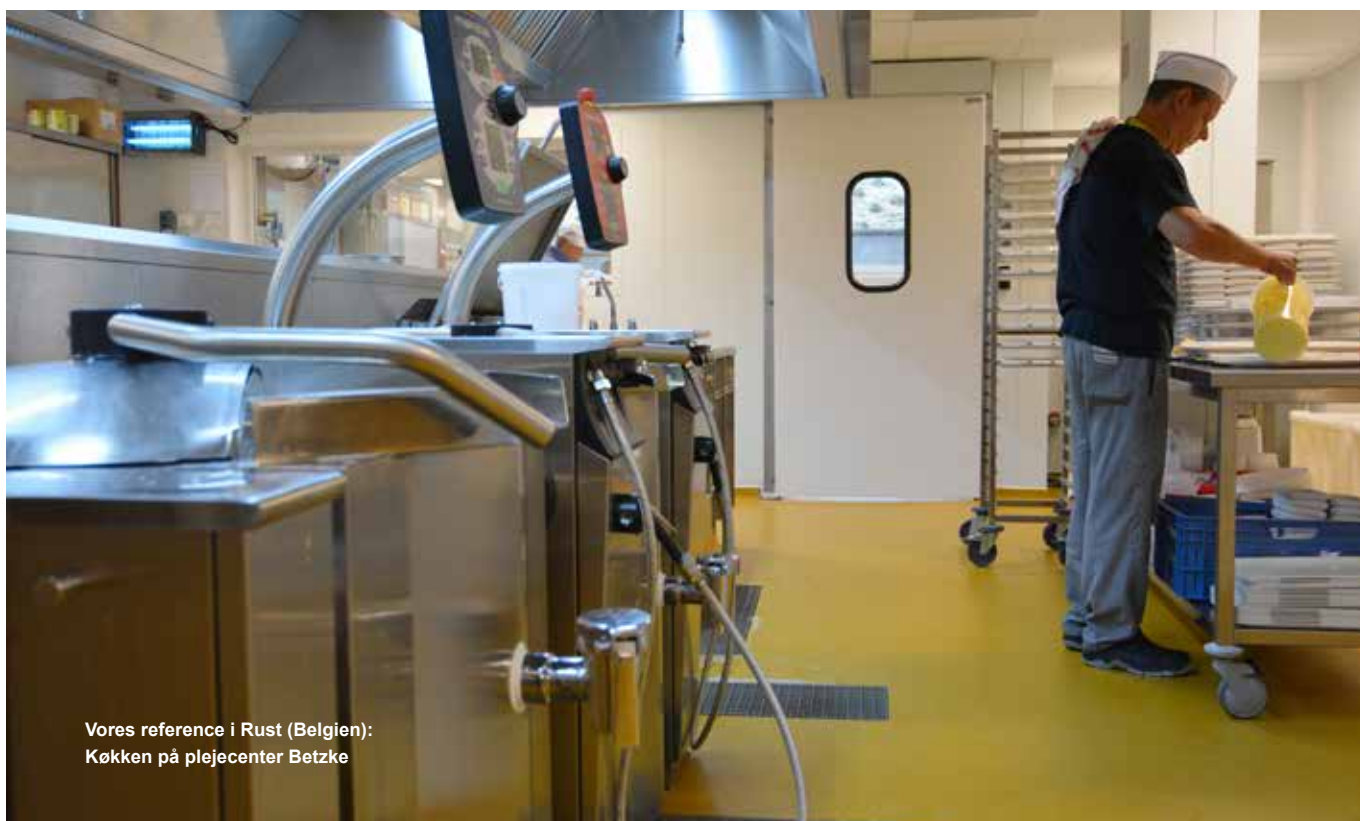
Vores reference i Rust (Belgien): Køkken på plejecenter Betzke

Ucrete gulve blev oprindeligt udviklet til at møde krav i industrien. Derfor er de utroligt slidstærke, med høj slagstyrke og kan holde til at der fx tabes tunge gryder. Samtidig har de høj kemisk resistens og tåler citronsyre, eddike, sukker og lignende. Ucrete gulve kan også anvendes i køle- og fryserum, idet de tåler helt ned til -40°C.