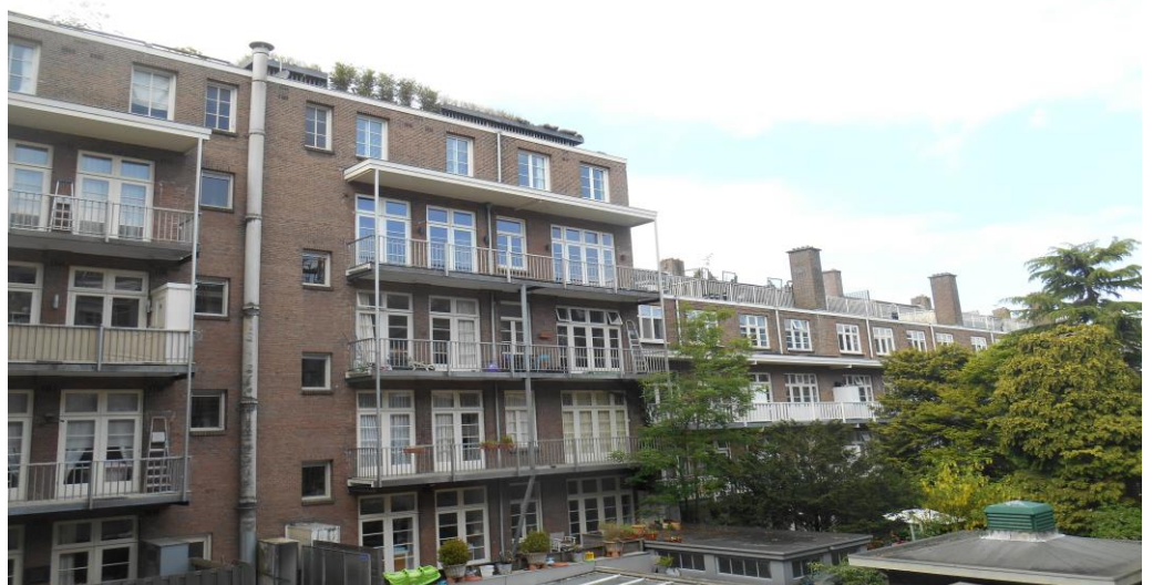
Onze referentie in Amsterdam (Nederland): Renovatie balkonvloeren