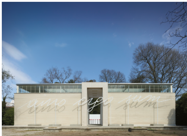
Renate Bertlmann, Discordo Ergo Sum, 2019, Padiglione Austria, Installation View