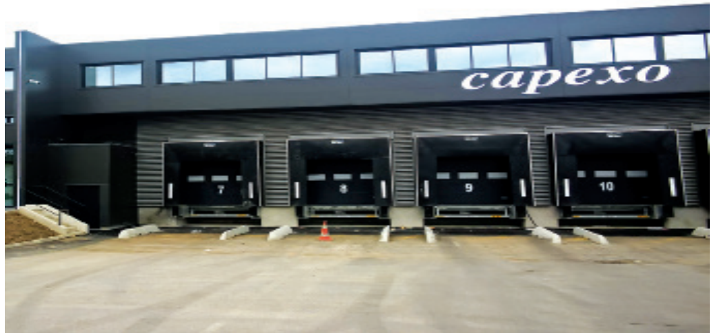
Notre référence en France : Capexo - Chevilly-Larue