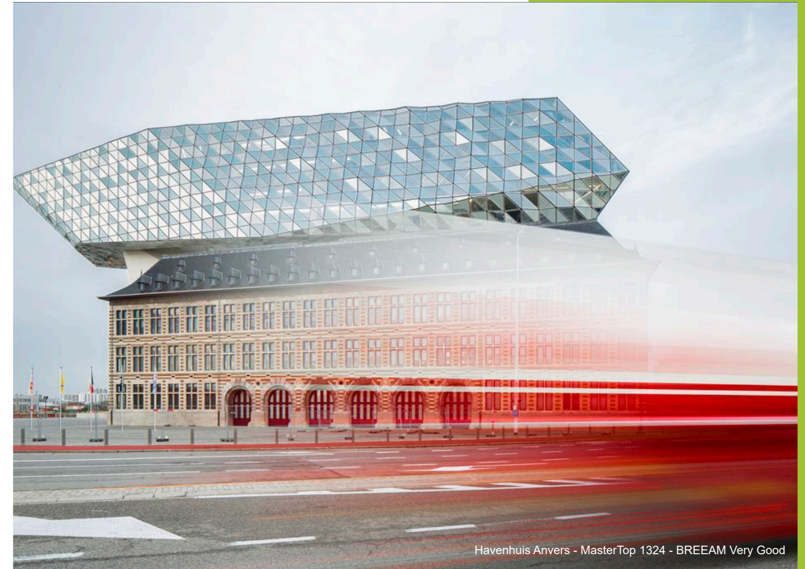
Havenhuis Anvers - MasterTop 1324 - BREEAM Very Good