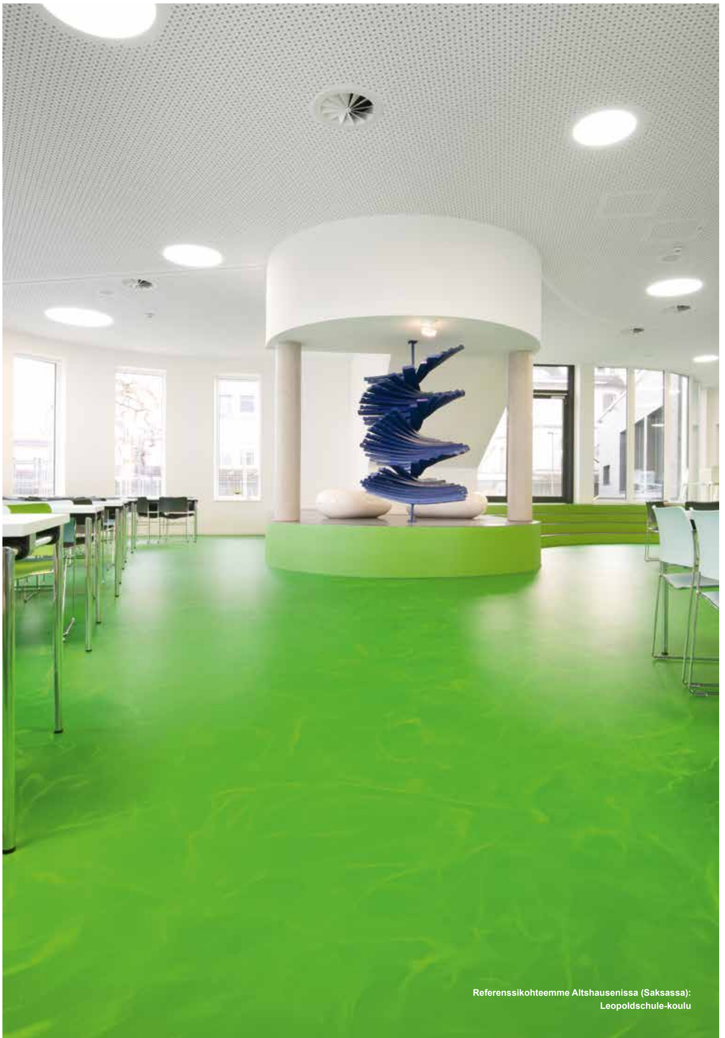
Referenssihoiteemme Altshausenissa (Saksassa): Leopoldschule-koulu