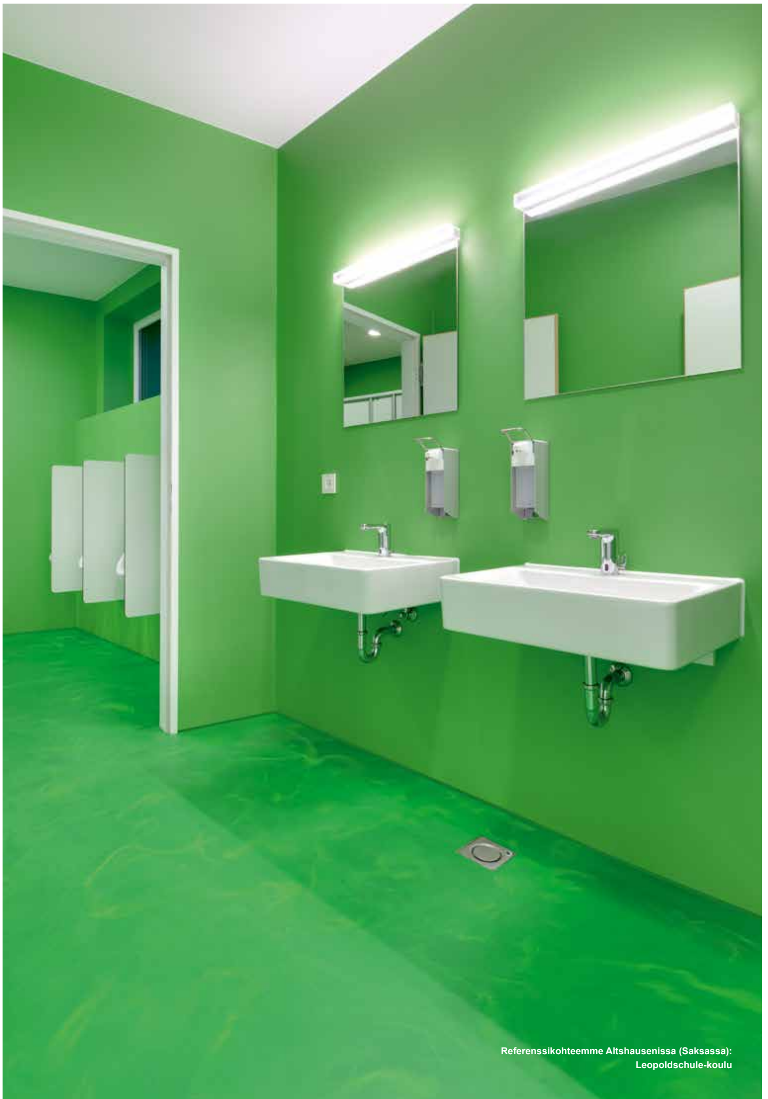
Referenssihoiteemme Altshausenissa (Saksassa): Leopoldschule-koulu