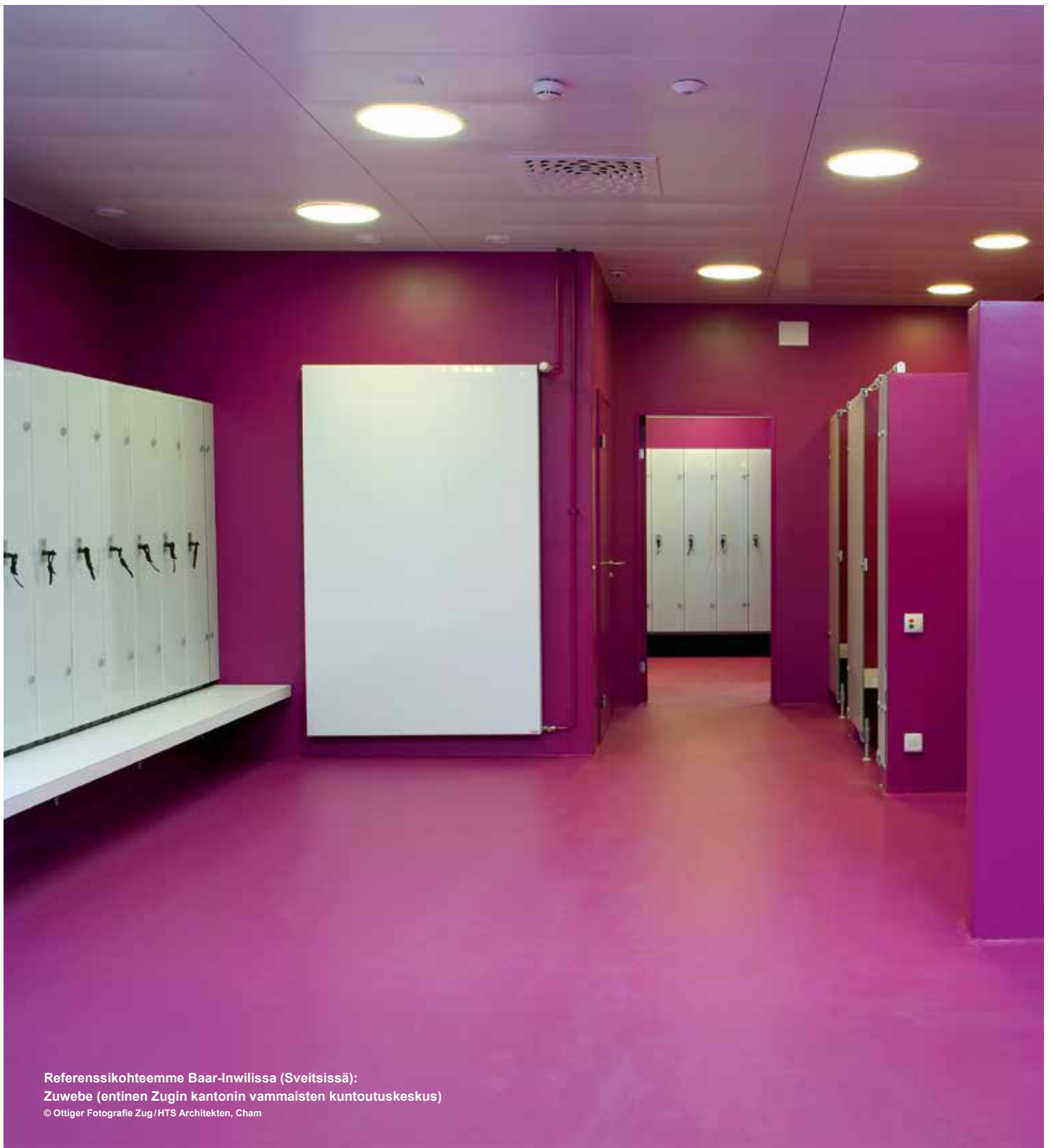
Referenssi kohteemme Baar-Inwilissa (Sveitsissä): Zuwebe (entinen Zugin kantonin vammaisten kuntoutuskeskus) © Ottiger Fotografie Zug / HTS Architekten, Cham