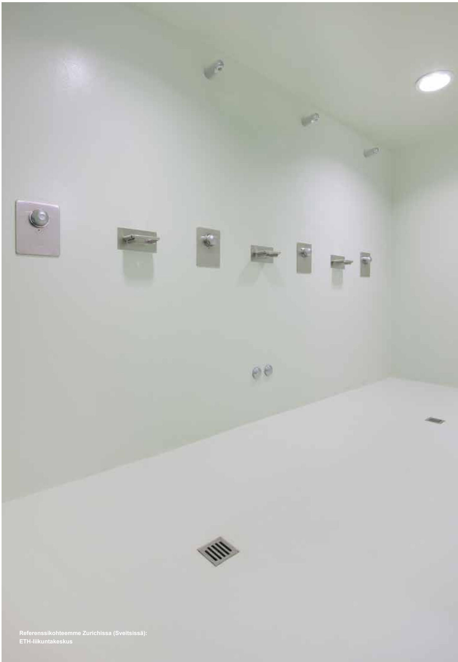
Referenssi kohteemme Zürichissä (Sveitsissä): ETH-liikuntakeskus