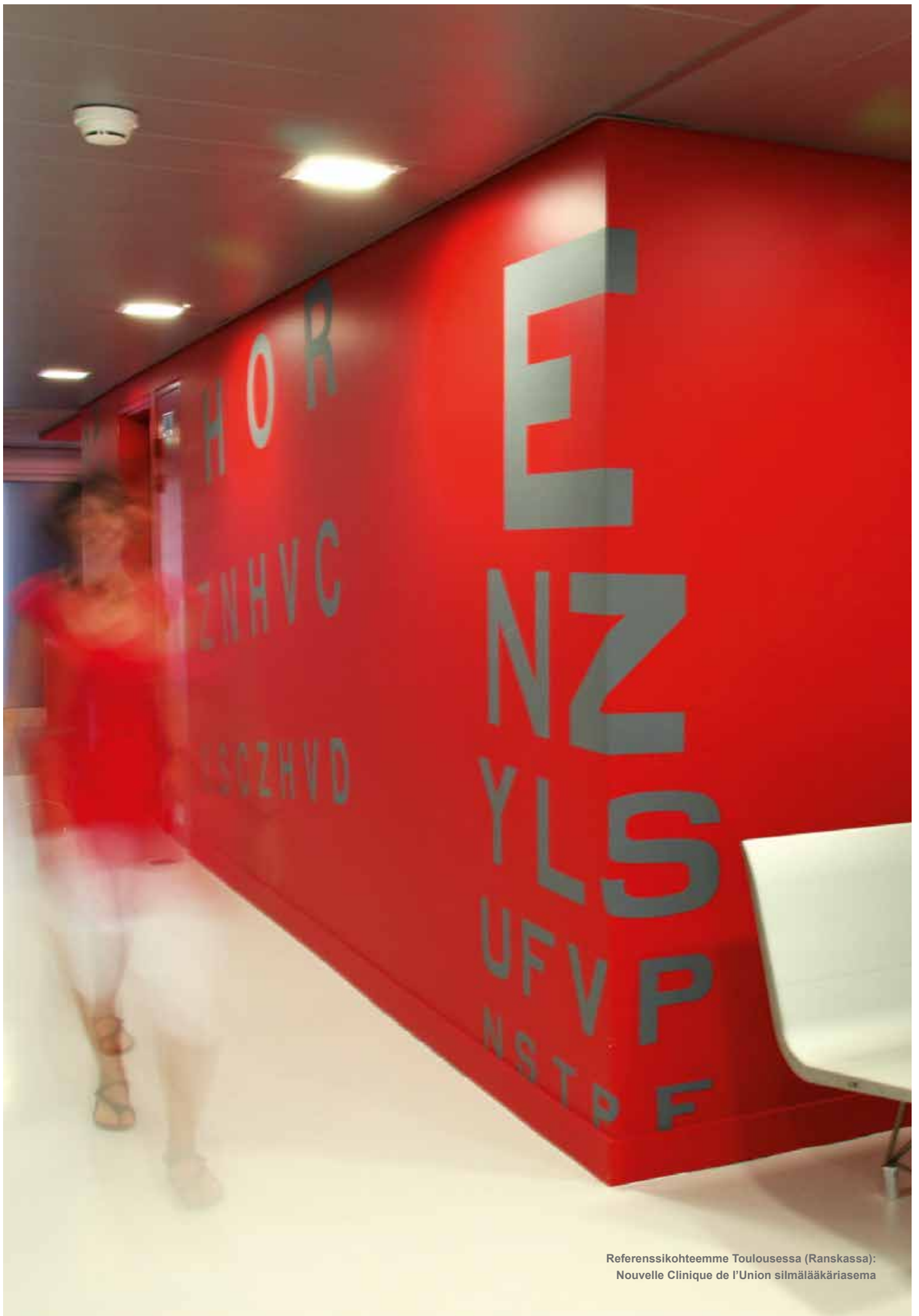
Referenssihoiteemme Toulousessa (Ranskassa): Nouvelle Clinique de l'Union silmälääkäriasema