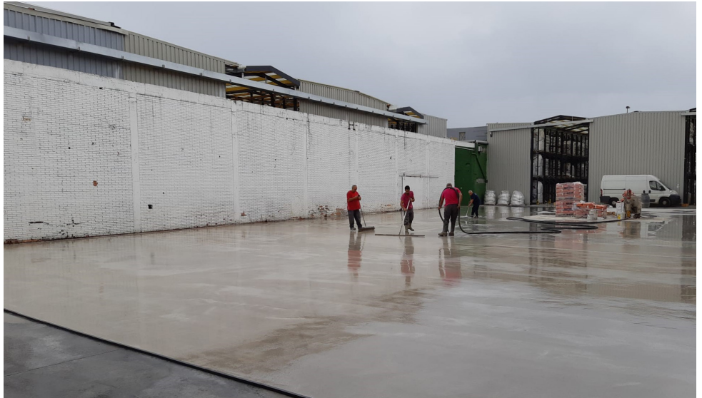
Pavimento continuo sobre solera en Asúa Products. MasterTop 514 QD sellado con MasterTop TC 445