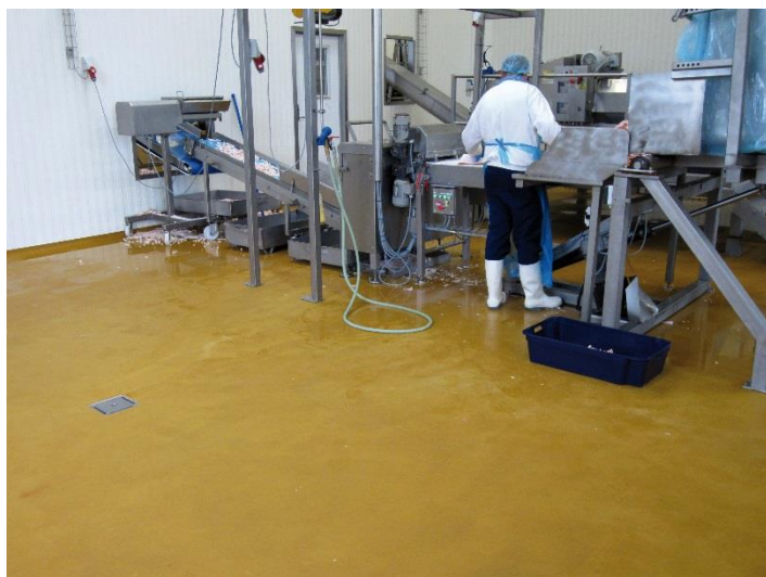
Vores reference: Ucrete gulve hos OK Snacks.