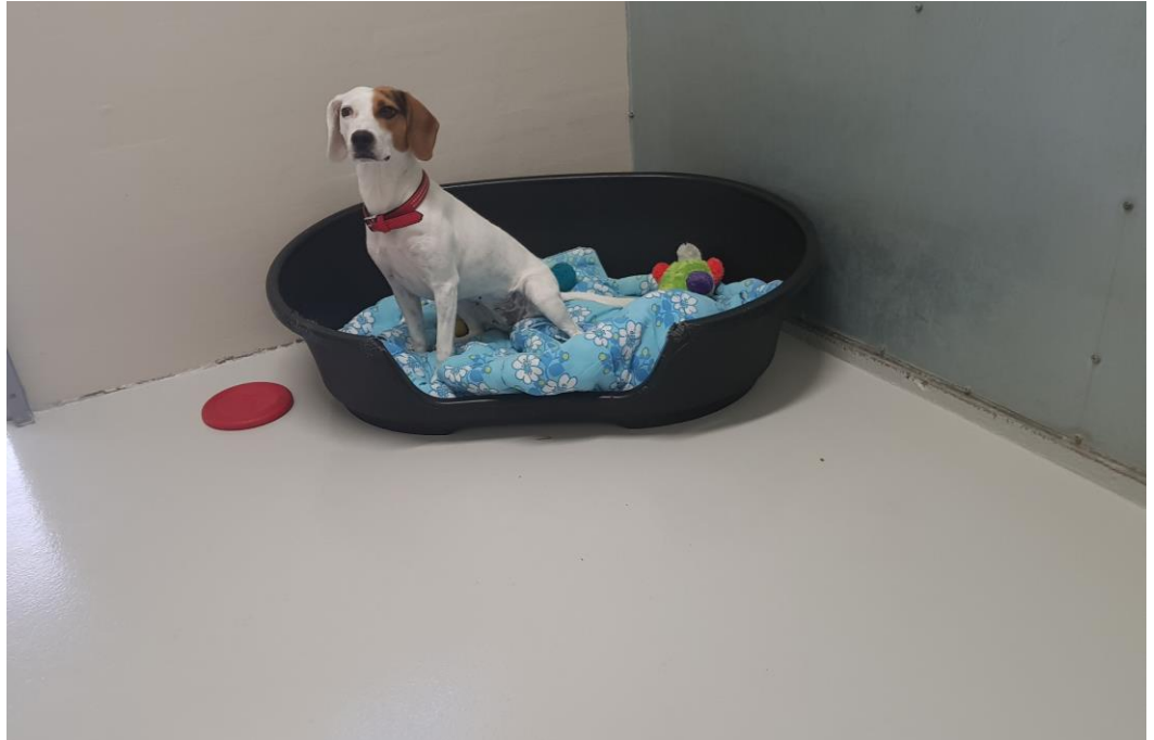
Vores reference: Ny gulvbelægning på Dyreværnets internat i Rødovre