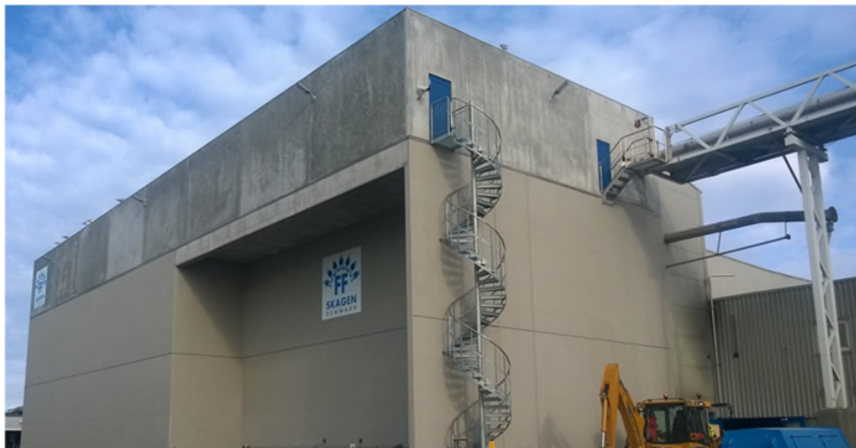
La nostra referenza a Skagen (Danimarca): Cisterne per mangimi per pesci FF Skagen