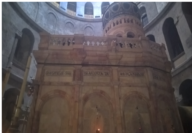
La nostra referenza presso l'Edicola del Santo Sepolcro a Gerusalemme (Israele)