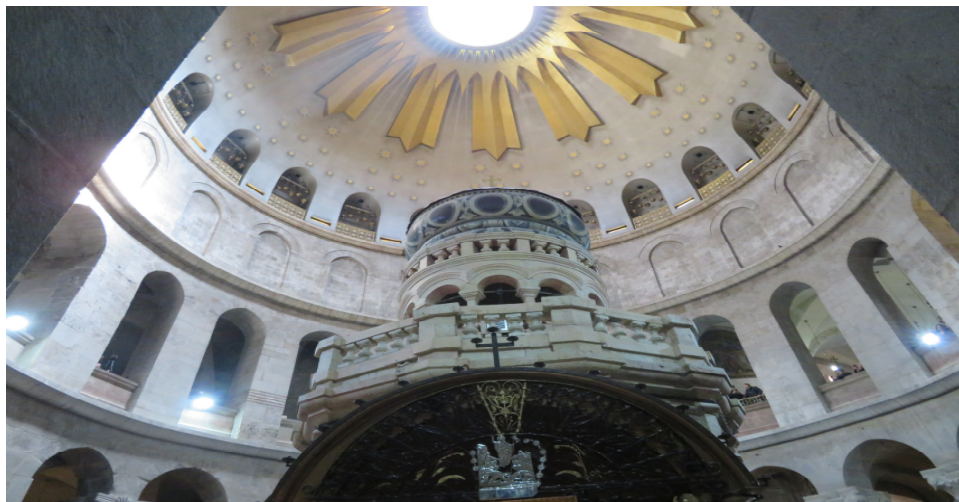
La nostra referenza presso l'Edicola del Santo Sepolcro a Gerusalemme (Israele)