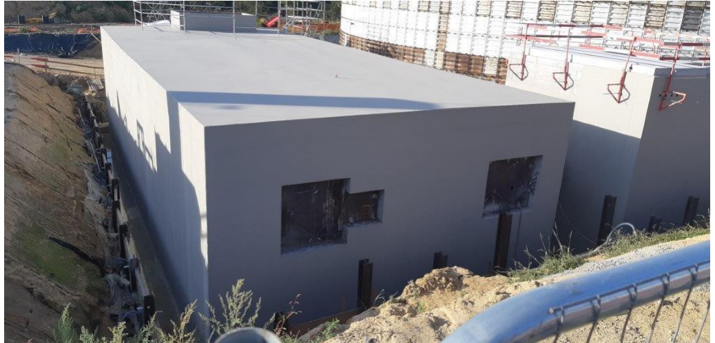
Onze referentie in Asse (België): Farys