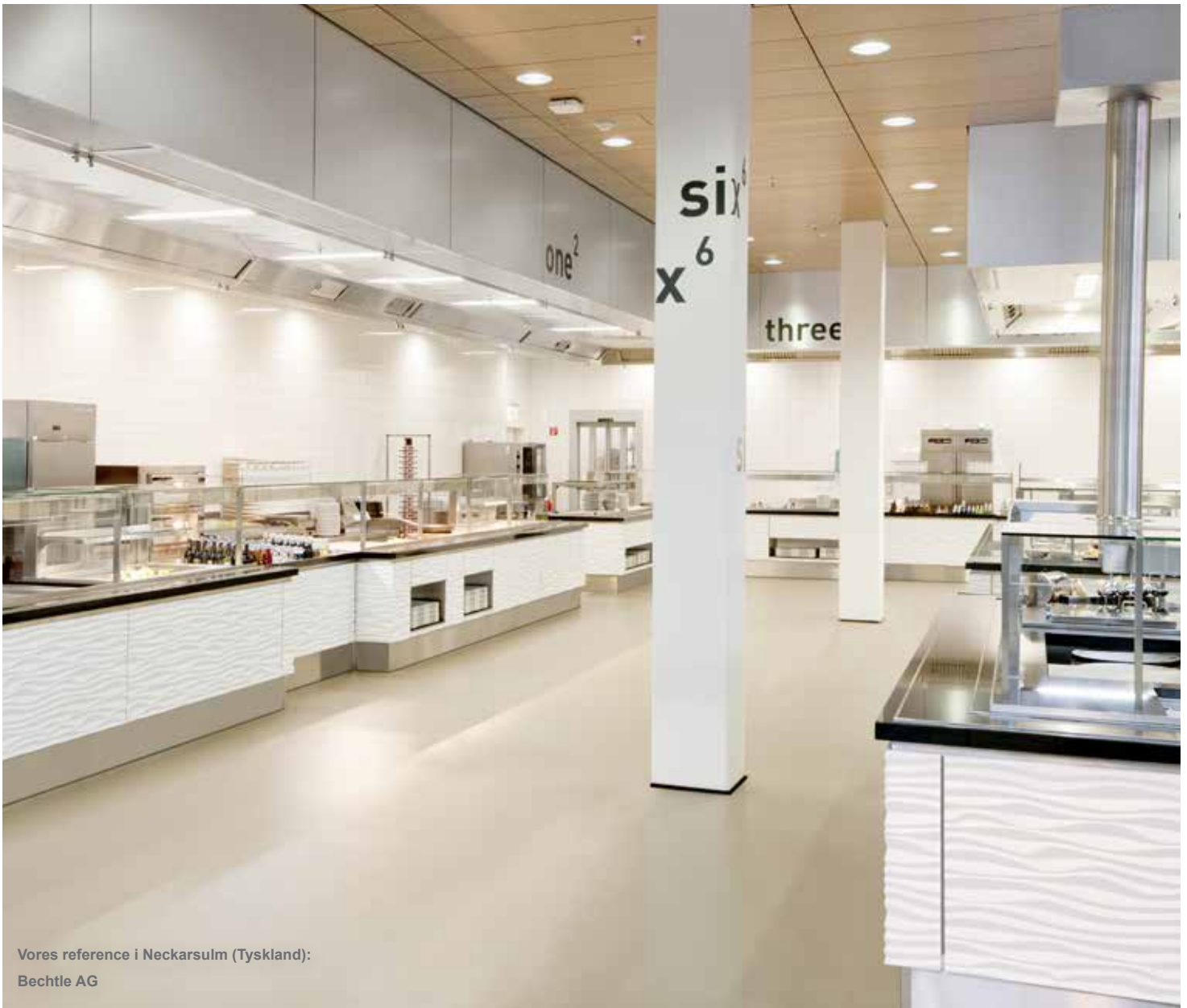
Vores reference i Neckarsulm (Tyskland): Bechtle AG