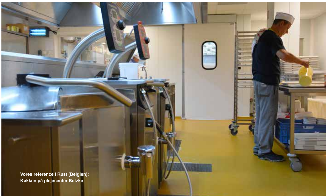
Vores reference i Rust (Belgien): Køkken på plejecenter Betzke

Ucrete gulve blev oprindeligt udviklet til at møde krav i industrien. Derfor er de utroligt slidstærke, med høj slagstyrke og kan holde til at der fx tabes tunge gryder. Samtidig har de høj kemisk resistens og tåler citronsyre, eddike, sukker og lignende. Ucrete gulve kan også anvendes i køle- og fryserum, idet de tåler helt ned til -40°C.